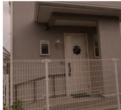
玄関扉 | 交換 外壁 | 塗装