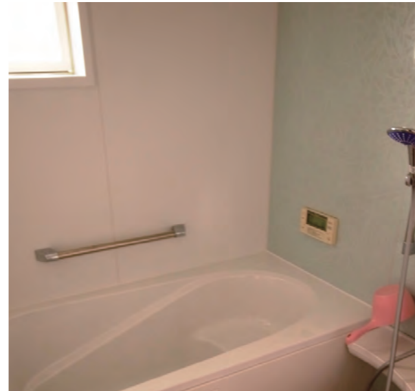
風呂場 | 設備取り替え