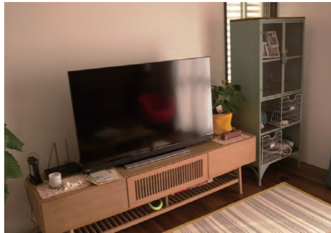
118 リビング | クロス全面張り替え・床張り替え