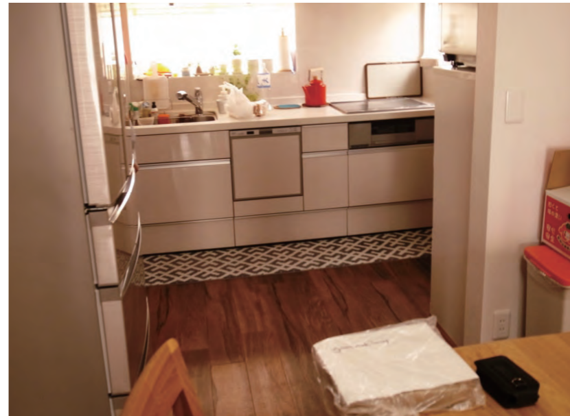
キッチン | 設備取り替え