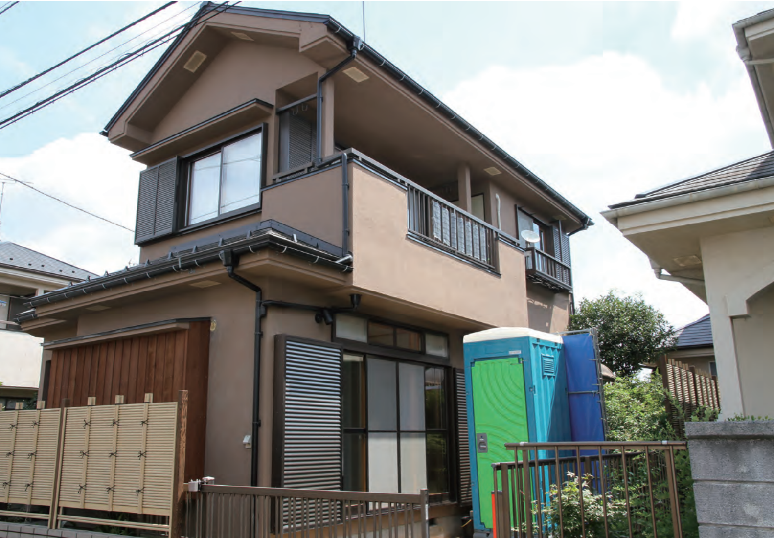
外観 | 断熱改修・屋根カバー工法・外壁塗装