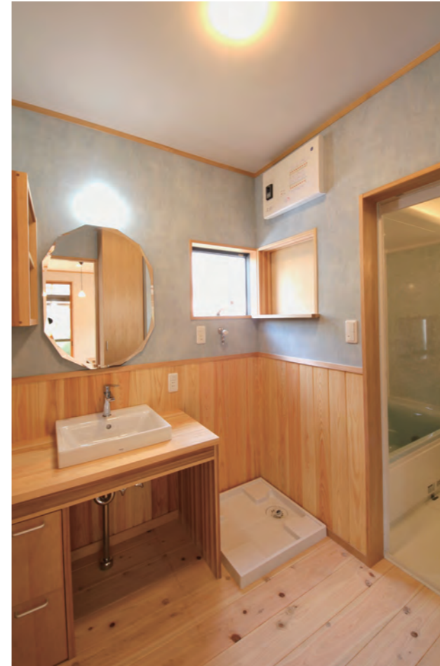
洗面室 | 設備取り替え