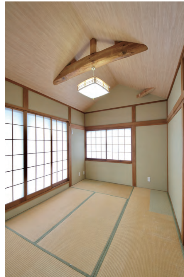
和室 | 畳貼り替え・天井を勾配天井へ