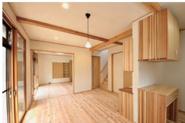
30 リビング | クロス全面張り替え・床無垢フローアー