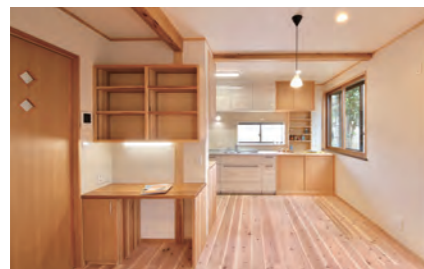
ダイニング・キッチン | 造作家具作成