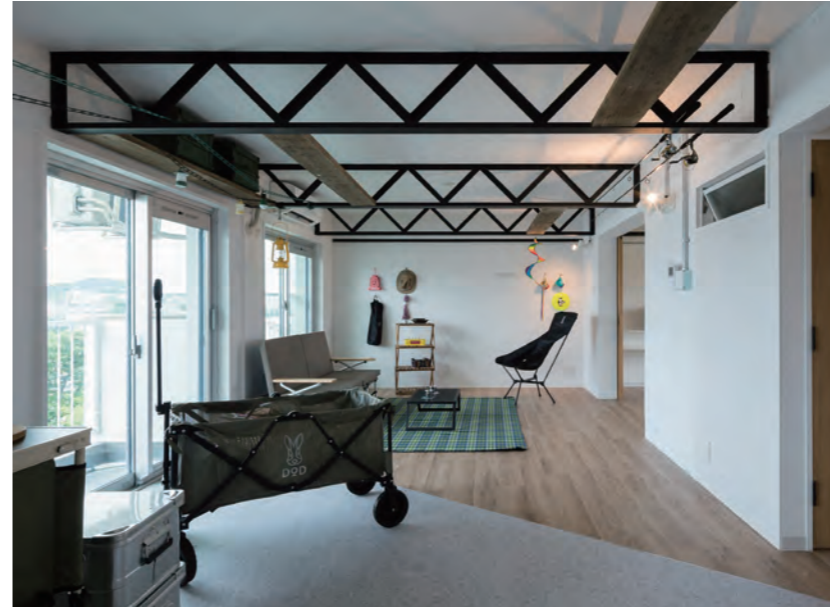
リビング | ハングングインテリアを取り入れ