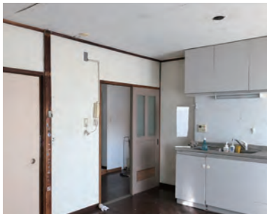
キッチン | 施工前