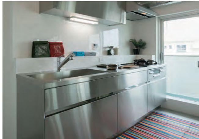
38 キッチン | 設備取替え