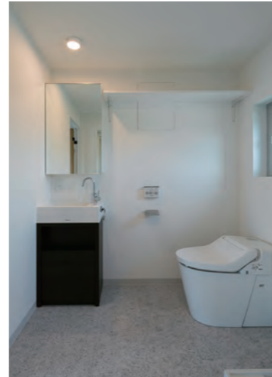
トイレ | 設備取り替え