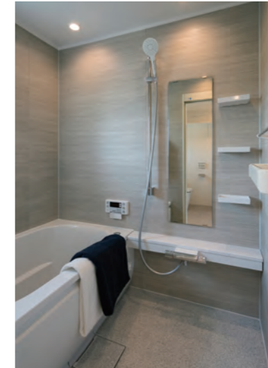
風呂場 | 設備取り替え