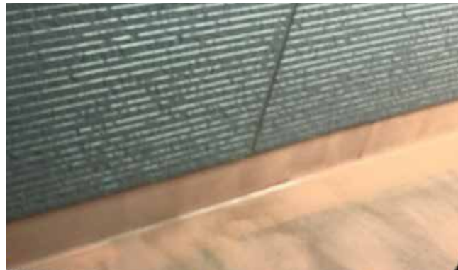
ベランダ | 防水塗装