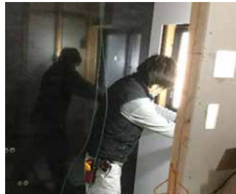
ユニットバス | 交換