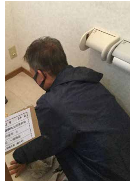
キッチン | 設備取り替え