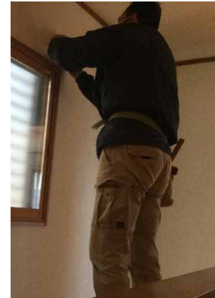
2Fホール | 内装クロス張り替え