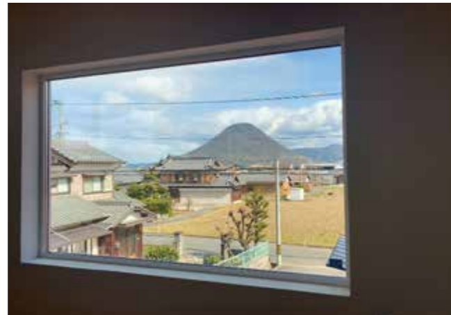
108 吹抜け設置 | 地元でも有名な山を直視できる[風水]