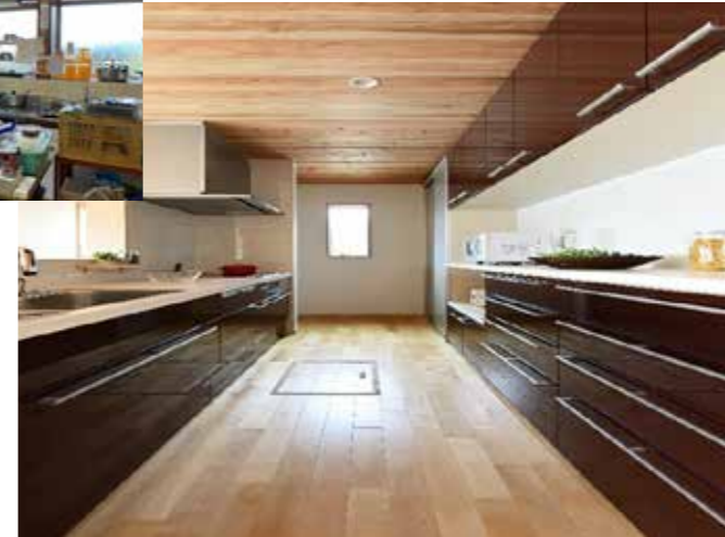
キッチン | 設備取り替え