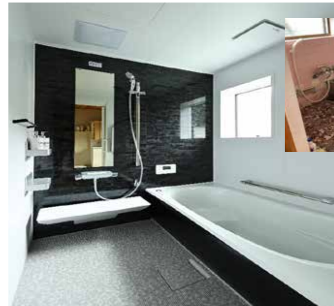
風呂場 | 設備取り替え