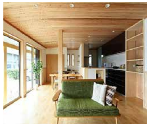
内装 床・壁・天井全面張り替え、サッシ | 交換