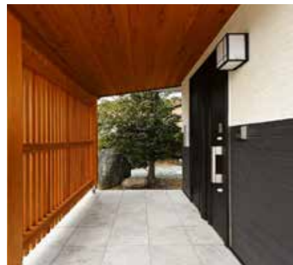
玄関扉 | 交換 外壁 | 張り替え