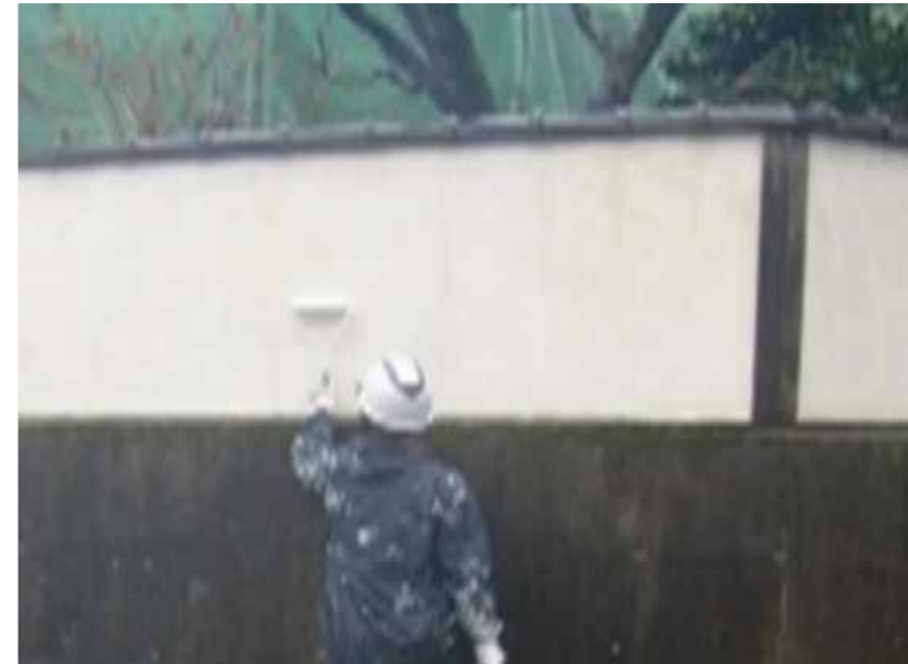
塀 | 塗装