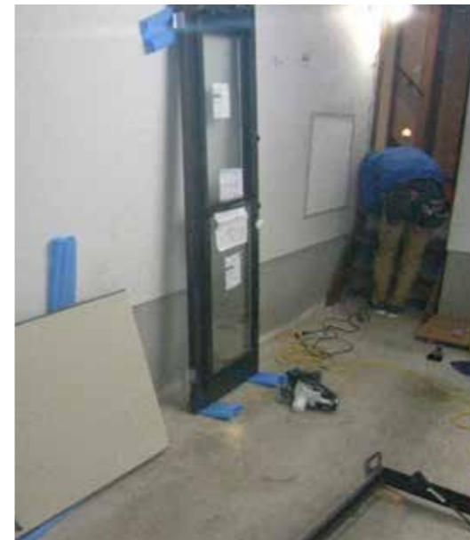
勝手口 | 既存ドア撤去、アルミドア取付