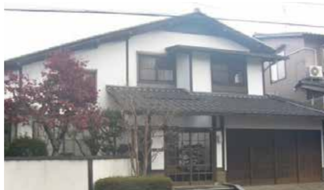
外観 | 施工前