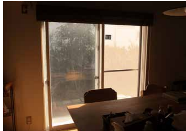
60 窓 | 二重サッシに交換