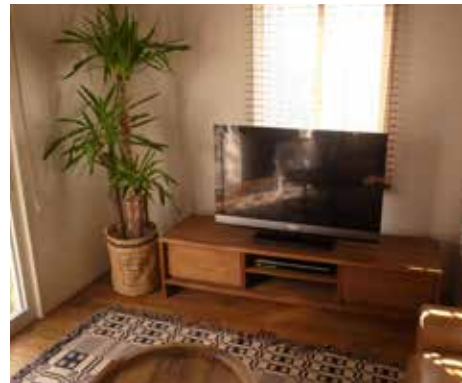
リビング | 断熱改修[床・壁]