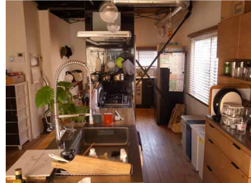
キッチン | 位置変更、設備取り替え