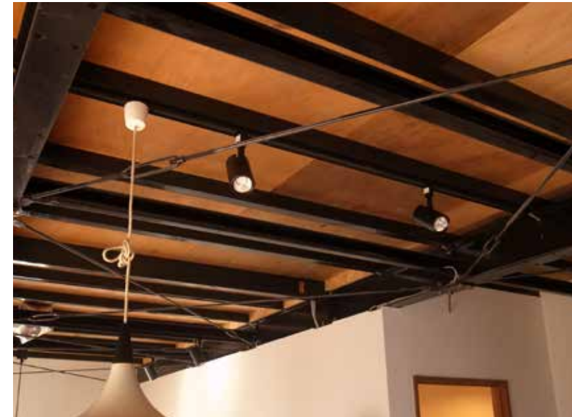
天井 | 撤去