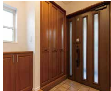
玄関扉 | シューズクロゼット 既存利用