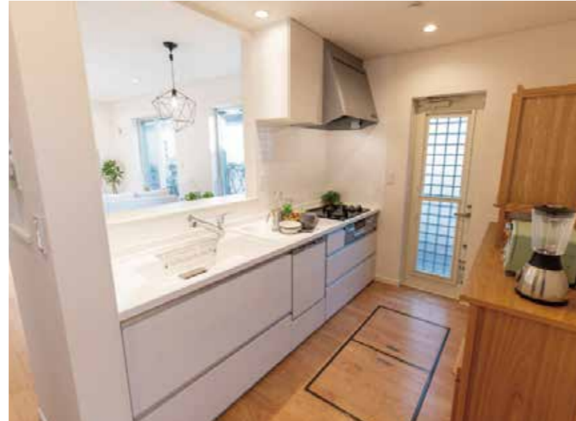
キッチン | 設備交換