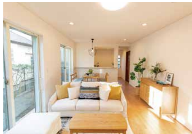
48 リビング | クロス全面張り替え・床張り替え