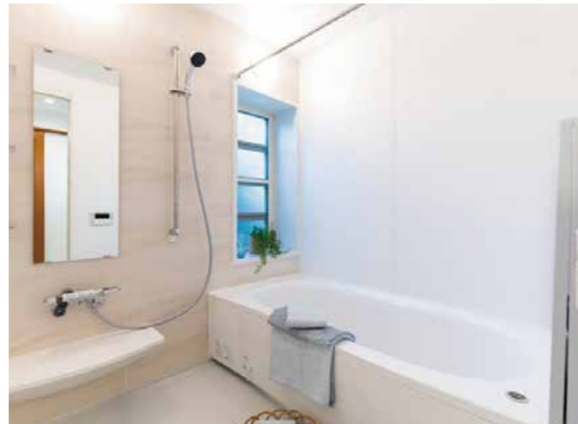
風呂場 | 設備交換