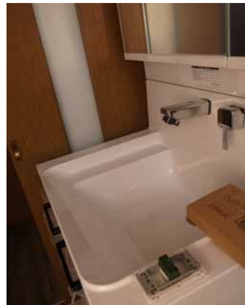
洗面台 | 設備交換