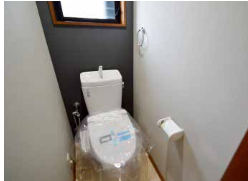
トイレ | 設備交換