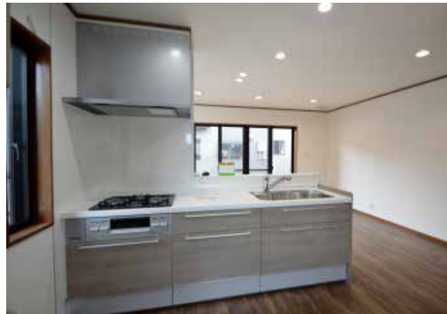
42 キッチン | 設備交換・床張替え