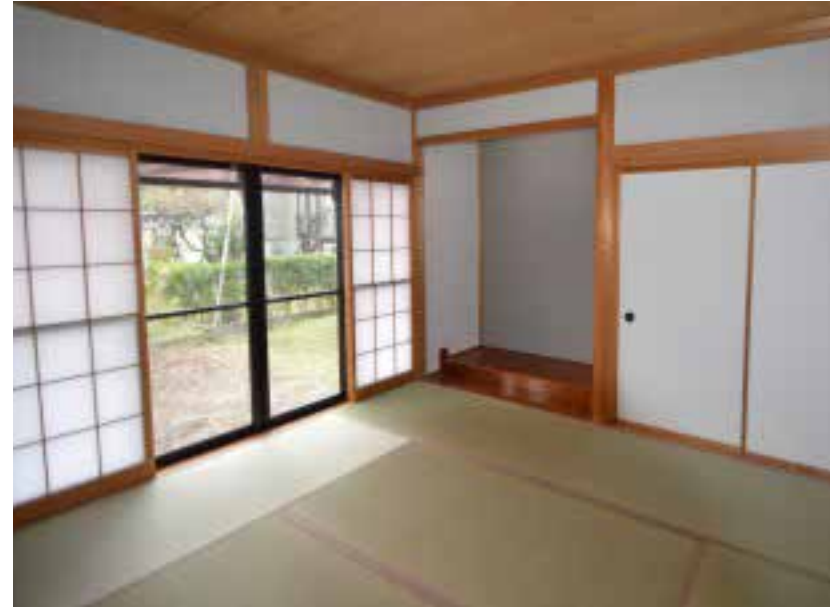
和室 | 畳張替え