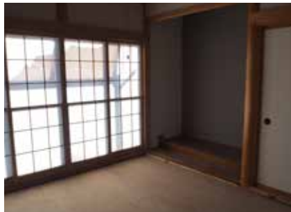
和室 | 施工中