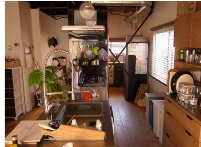
キッチン | 位置変更、設備取り替え