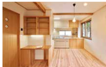
ダイニング・キッチン | 造作家具作成