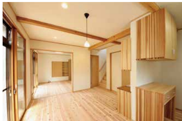
26 | リビング | クロス全面張り替え・床無垢フローアー