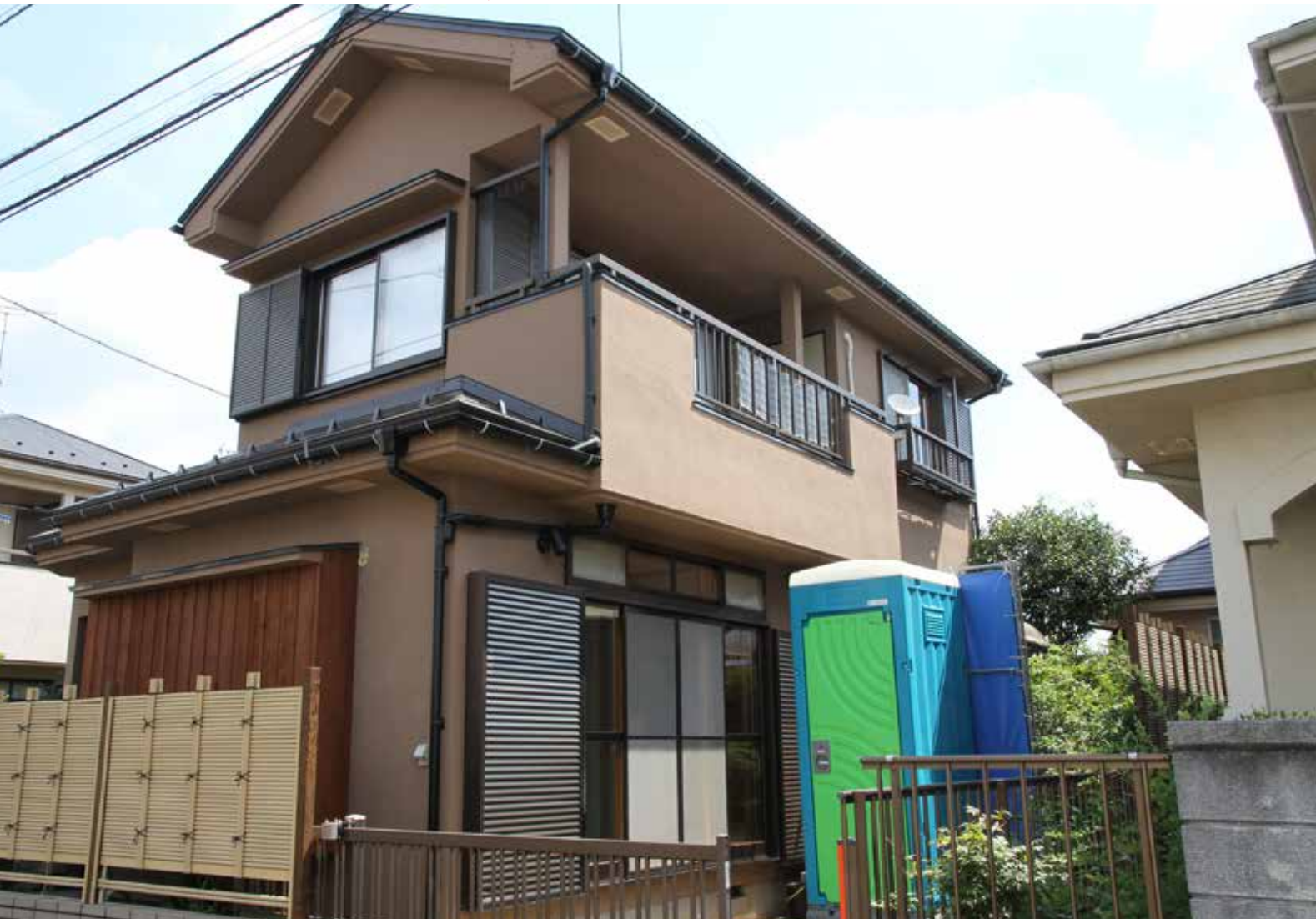
外観 | 断熱改修・屋根カバー工法・外壁塗装