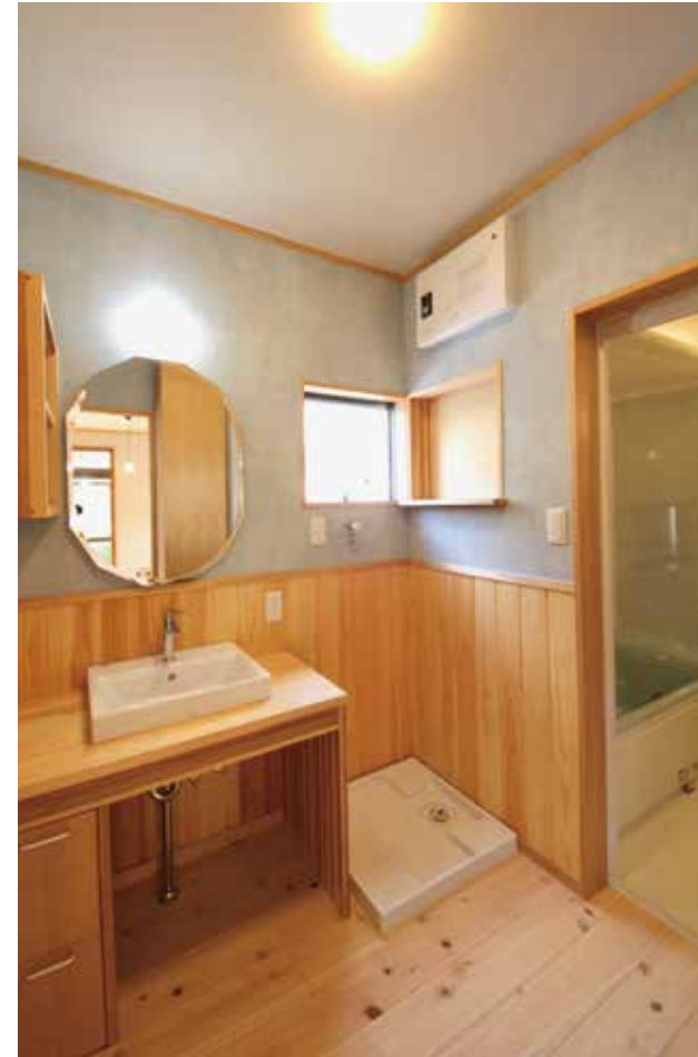
洗面室 | 設備取り替え