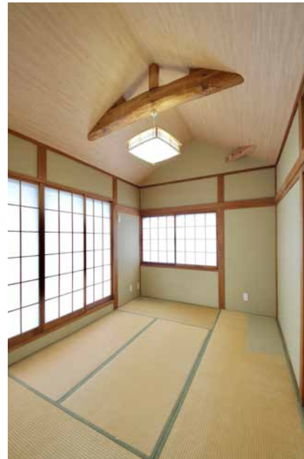
和室 | 畳貼り替え・天井を勾配天井へ