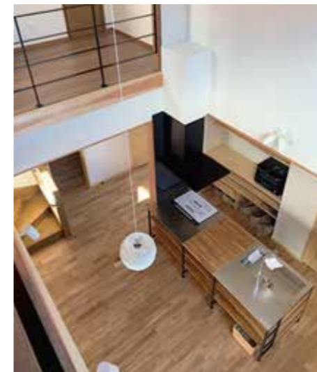
吹抜けよりLDKをみる