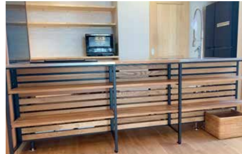
キッチン | 設備取り替え[車いす対応に改造できる]