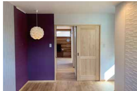
リビングより寝室を見る 仕上全面張り替え