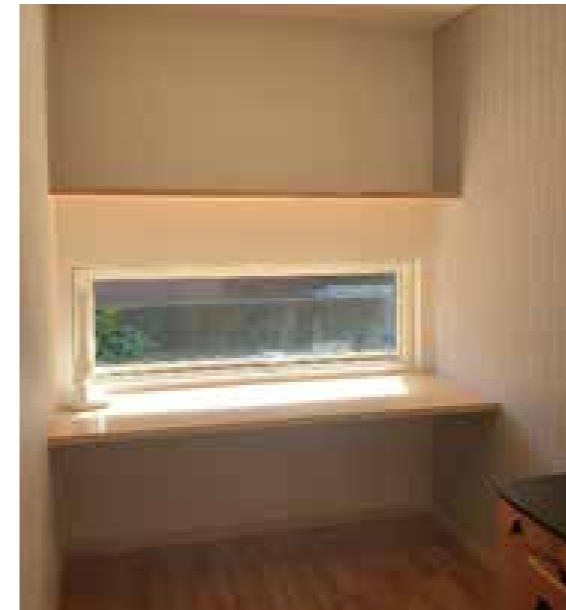
奥様の書斎[家事室]