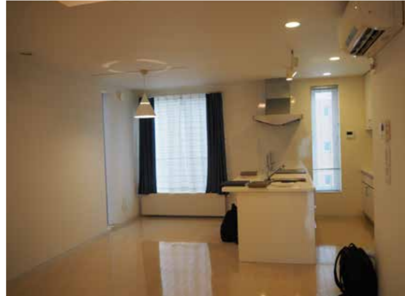
リビング | クロス張り替え