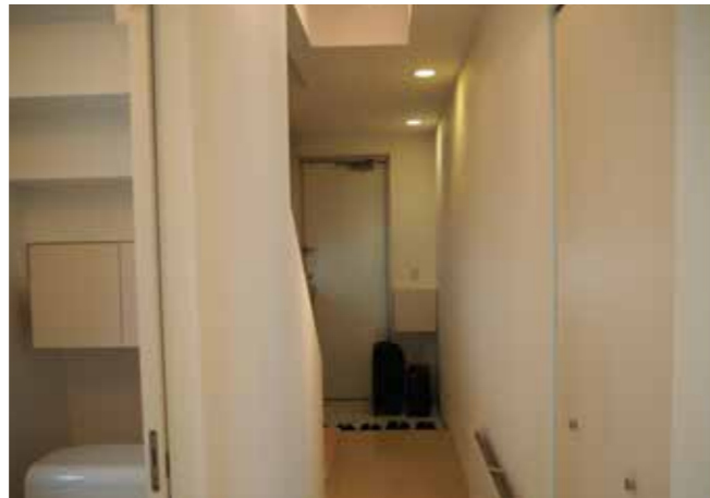
30 玄関・廊下 | クロス張り替え