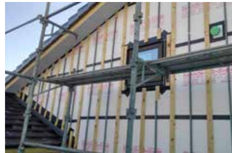
施工中 | 外断熱