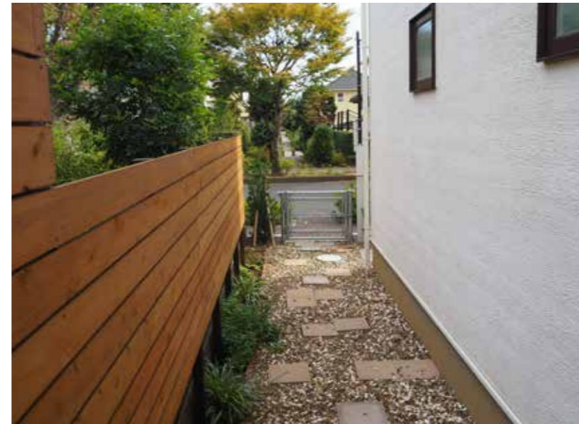
路地庭 | 柵、敷石設置