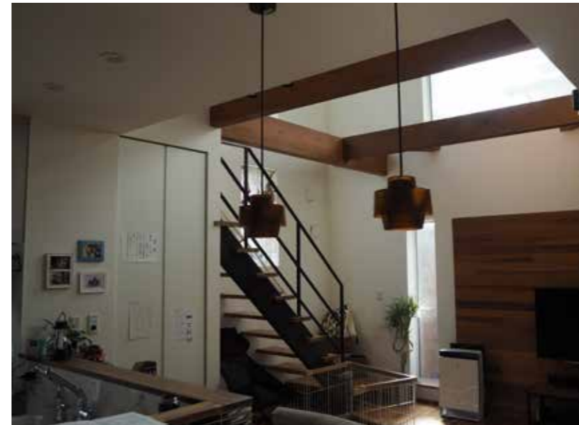
リビング | 吹き抜け設計