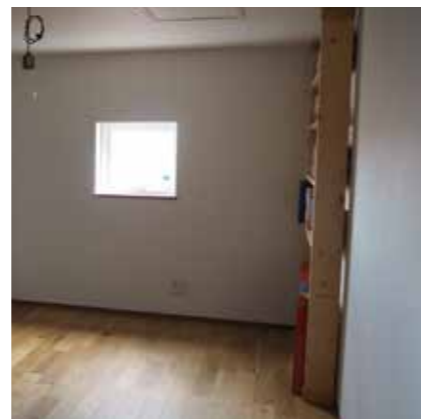
小屋裏 | 採光取り入れ、天井高も確保