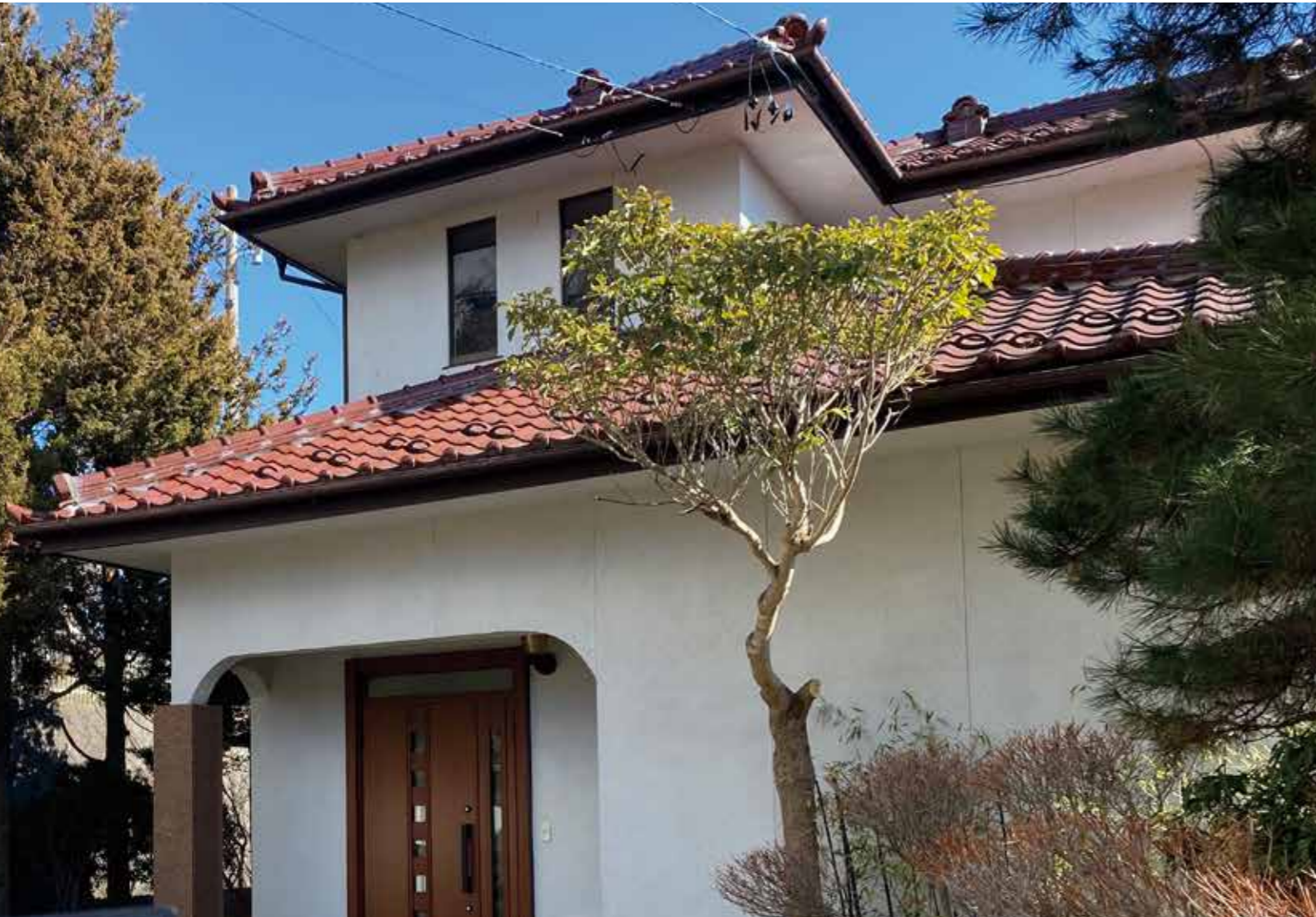
外観 | 窓廻りモルタル補修 床下 | 防蟻・防蟻処理