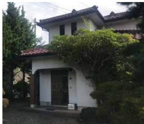
18 外観 | 施工前