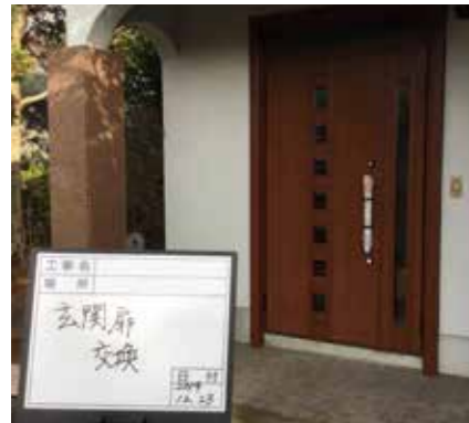
玄関 | 断熱親子ドアに交換