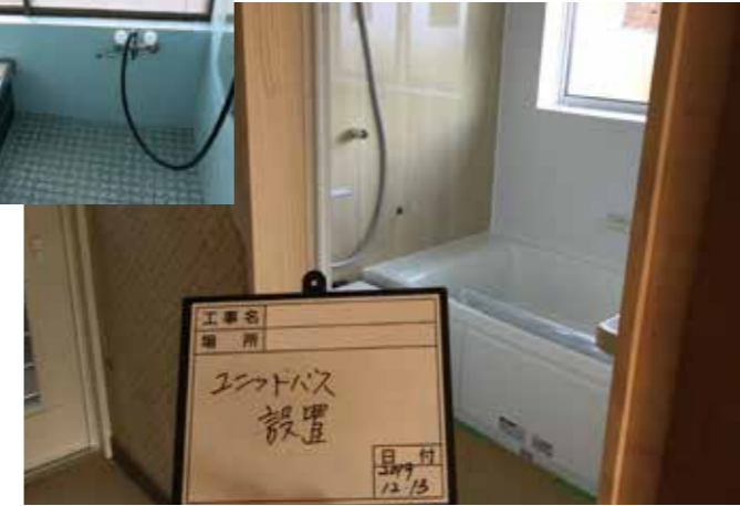
風呂場 | 設備交換 ユニットバスを設置