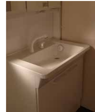
洗面台 | 設備取り替え