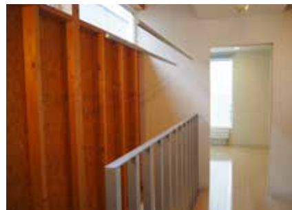
2階廊下 | クロス張り替え