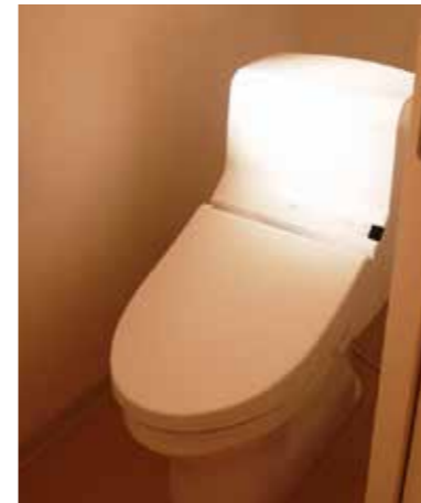
トイレ | 設備取り替え