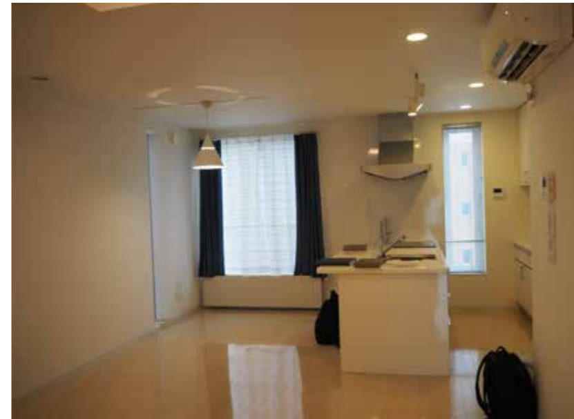
リビング | クロス張り替え