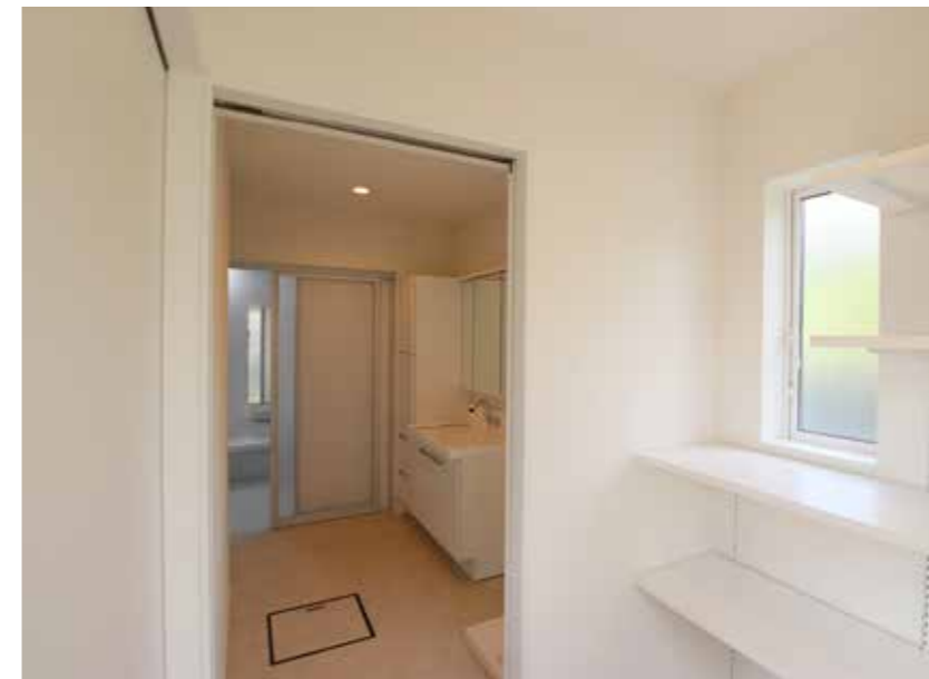
風呂場 | 設備取り替え・位置変更