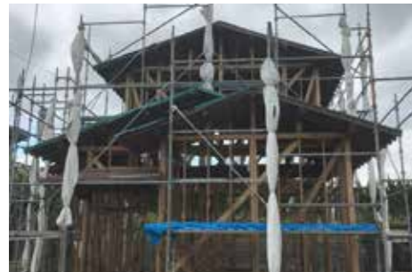
外観 | 施工中