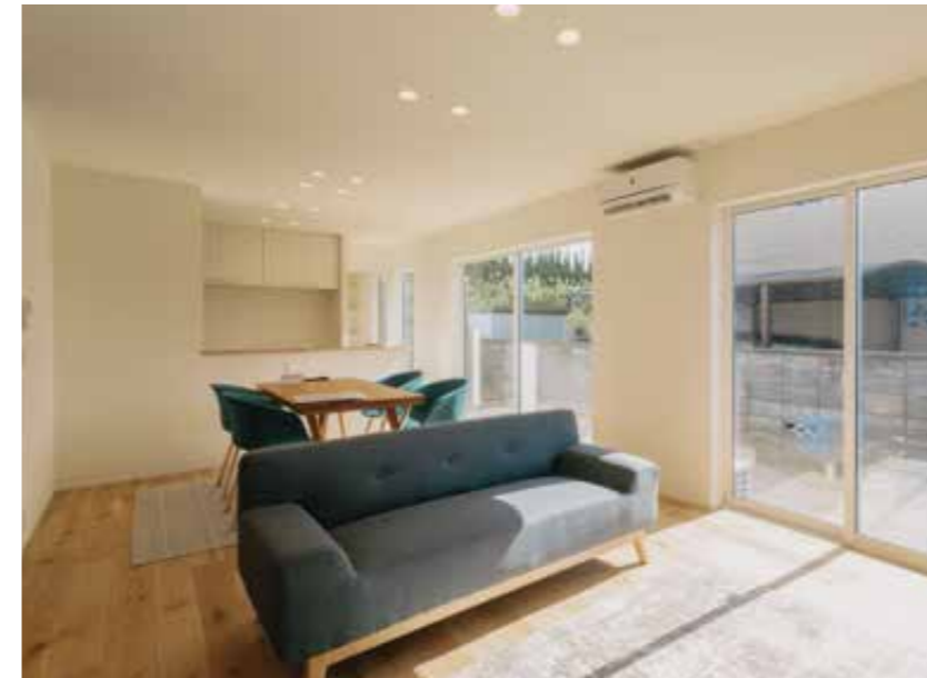
キッチン・ダイニング | クロス全面張り替え・床張り替え