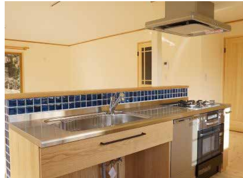
キッチン | 設備取り替え