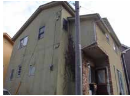
外観 | 施工前