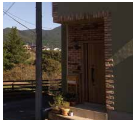
玄関扉 | 交換 外壁 | 塗装