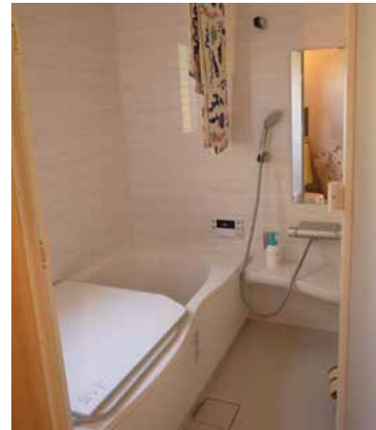
風呂場 | 設備取り替え