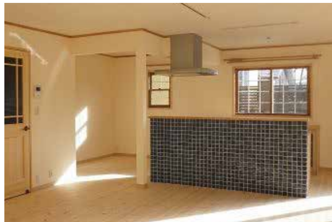
10 リビング | 漆喰塗り・床張り替え・二重サッシ交換